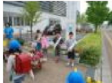
みんなであいさつ「あいさついっぱい」