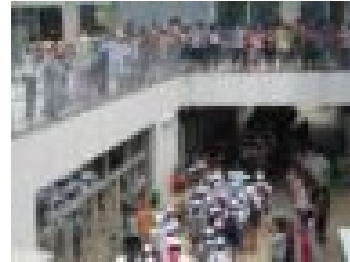
全校児童による盛大な見送り