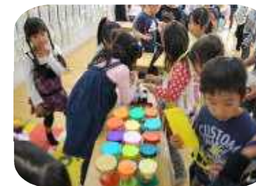
2年生 フェスティバル 生活科で学んだ成果をお祭りのお店にしました。1年生を招待して、友だち同士の関わり合いを深めました。