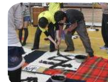
5・6年生 書道キャラバン隊 書の専門家の大作の見事な実演を見学しました。児童や教師も気合いを入れて大作に挑戦しました。