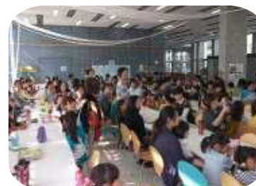
1年生 サツマイモパーティー 収穫したサツマイモで茶巾絞りを作り、保護者・地域の方を招待してすてきなパーティーを開きました。