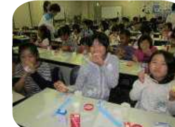
3年生 社会科見学 明治乳業関東工場に行きました。見学したり、バター作りを体験したりしました。味は格別でした。