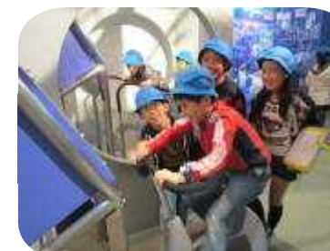
5年生 社会科見学 コカコーラ多摩工場と環境科学国際センターを見学しました。製造工程を見学したり、環境について学んだりしました。