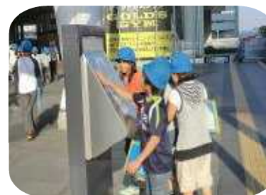
4年生 社会科見学 新都心を見学しました。交通の要所として、またバリアフリーで作られている街を実際に体験してきました。