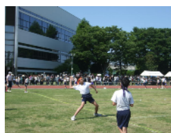
ソフトボール投げ