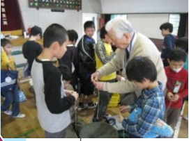
南小まつり (地域の方も参加してくれます)

生徒指導の充実 学校不適應の解消 カウンセリング手法を 身につけた教育相談 心の通う個別指導 基本的生活習慣確立