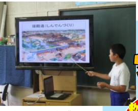
↑ICTを活用した授業の展開