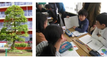
↑モ子の木 (シンボルツリー)

日本国憲法、教育基本法 学校教育法、学習指導要領 文部科学省の重点施策・指導の重点 県の重点施策・指導の重点 ・「教育に関する3つの達成目標の」推進 ・学習状況調査結果等の分析と活用の推進 ・「埼玉の子ども70万人体験活動」の推進 ・「学校応援団」づくりの推進 ・幼稚園・保育園等との連携の推進 市の指導の重点・主な施策 ・・・未来を拓く子どもたちのために・・・ ・確かな学力の育成 ・豊かな心の育成 ・よりよい教育環境の整備 ・家庭・地域の教育力の向上