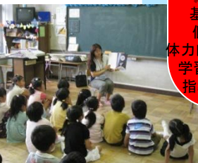
おはなしランド (保護者による読み聞かせ)

地域・保護者の願い! ○よく考えて正しく判断できる子 ○心豊かで思いやりのある子 ○健康で元気な子