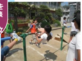
鉄棒キャンペーン

地域・保護者の願い! ○よく考えて正しく判断できる子 ○心豊かで思いやりのある子 ○健康で元気な子