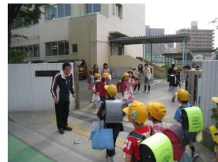
←朝のあいさつ運動

めざす児童像・課題 知識思考 知識を身につけ、創造的な思考力を持つ児童 情操 感性豊かで、心の安定した児童 強 韌 正義を尊び、善悪を正しく判断する児童 協 力 他人の立場を尊重し、友だちと協力できる児童 習 慣 規則正しい生活習慣を身につけた児童