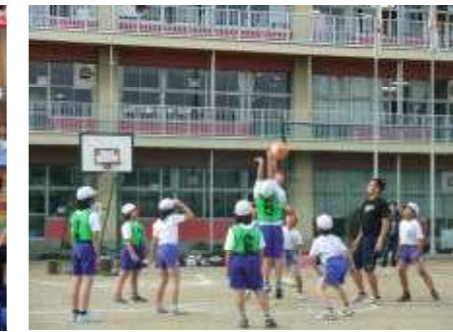
△市内球技大会 11月10日 本校を会場に、戸田第一小と新曽小も参加し、バスケットボールの試合が行われました。本校の5年生も全員参加し、大活躍でした。