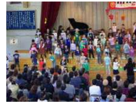
△彩の国教育の日学校公開 11月5日 音楽会と公開授業に延べ2,845人の方が参観してくださいました。本年度発足した金管クラブにも大きな拍手をいただくことができました。

なお、戸田市では、不審者情報等の電子メール無料配信「とだピースガードメール」サービスを行っています。詳しくは、市の防犯くらし交通課のホームページ( http://www.city.toda.saitama.jp/435/434061.html )をご覧ください。