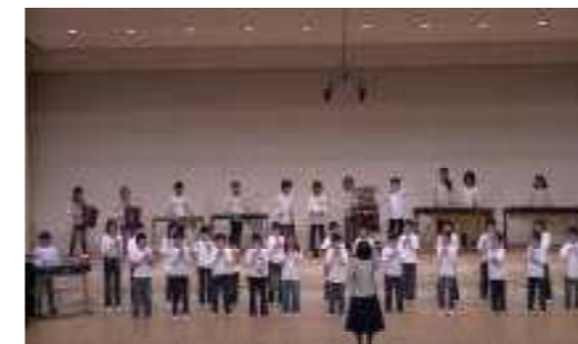
△戸田市小中学校音楽会 11月11日 本校からは、4年4組が代表として出場しました。きれいな歌声と音色が戸田市文化会館の大ホールに響き渡りました。