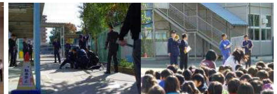
△不審者対応避難訓練 11月16日 刃物を持った不審者が校内に侵入したとの想定で、避難訓練を実施しました。埼玉県警本部と蕨警察署のご協力をいただき、パトカーも出動して不審者を捕捉(写真左)するなど本格的な訓練になりました。児童も職員も真剣に取り組みました。