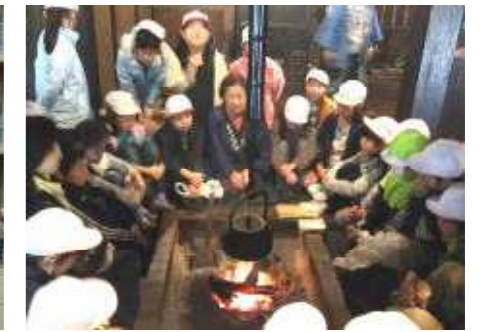
△3年校外学習 11月11日 雨のため「江戸東京たても園」他に行き先を変更しました。茅葺き屋根の家で囲炉裏を囲んで昔の話を聞いたり楽しい一日を過ごしました。