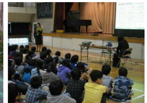
△ケータイ安全教室 12月22日 5年生が、携帯電話を使用する上でのマナーやルール、トラブルへの対処方法を携帯電話会社の方から学びました。