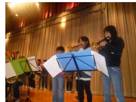
△音楽朝会 12月14日 金管クラブの伴奏で、「歓喜の歌」を全校児童で合唱しました。元気な歌声が、体育館中に響きわたりました。