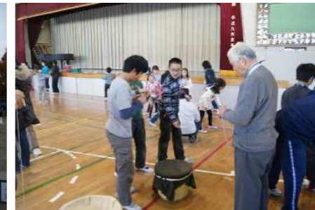
△南小まつり 12月15日 子どもたちがとても楽しみにしていた「南小まつり」を全児童が参加して行いました。学校応援団や地域の皆さまの催しもあり、楽しい一日となりました。