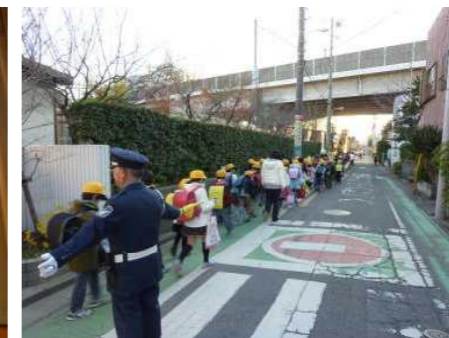
△一斉下校 12月20日 通学班指導の後、教員引率により全児童が通学班ごとに一斉下校をしました。また、12月19日からの1週間、登校時に教員が通学路に立ち、登校指導を行いました。なお、1月も登校指導を実施します。