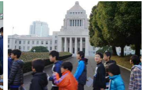
△6年社会科見学 12月16日 6年生が最後の校外学習で、国会と科学技術館の見学に行ってきました。厳粛な議場の雰囲気を感じることができるなど、実り多い学習となりました。