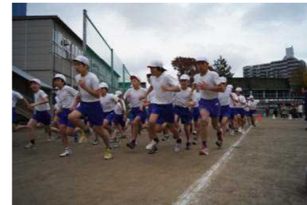
△持久走大会 12月1日 保護者の皆さまの声援を受け、元気いっぱい最後まで走り抜きました。マラソンキャンペーンの成果もあり、全体的に記録の向上が見られました。

書き損じの官製はがき等を盲老人ホームへ寄付します。書き損じの官製はがきや年賀はがきなどがございましたら、1月中に担任までご提出ください。ご協力よろしくをお願いいたします。