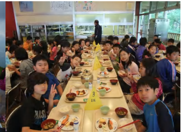
【写真】 左:入笠山山頂にて 右:朝食時の様子 下:飯盒炊さん体験