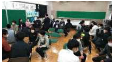
年度当初職員研修の様子

春の陽気に包まれたこの良き日に、戸田中学校の新年度をスタートできたことに、保護者の皆様、地域の皆様、そして本校教職員に心より感謝申し上げます。この度、歴史と伝統ある戸田中学校に赴任することができて誠に光栄です。これから誰もが認める誇りと自信に満ち溢れ、誰にとっても居心地の良い学校づくりに努めてまいりますのでどうぞよろしく願いいたします。