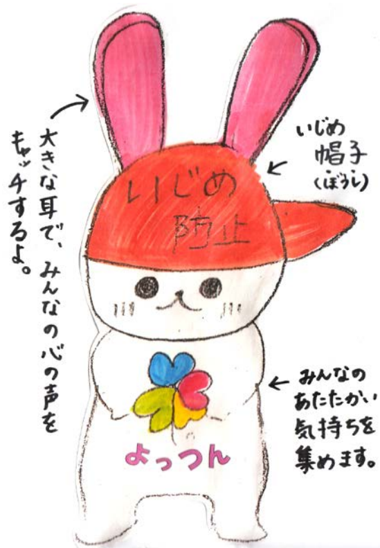
戸田東小学校いじめ防止キャラクター