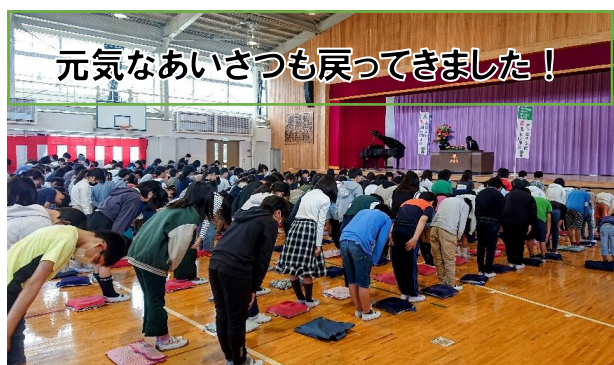
元気なあいさつも戻ってきました!