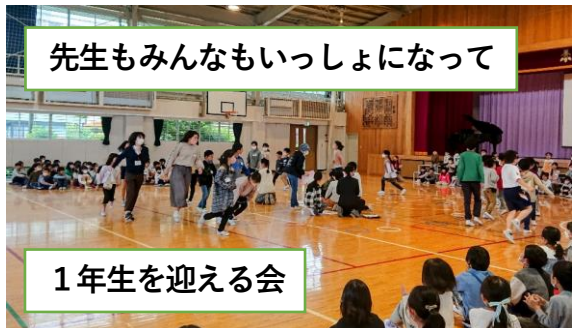
先生もみんなもいっしょになって

明日は今年度初めての参集型授業参観です。学校では、体験・経験も重視しながら、今まで以上に、個別最適化学習と協働的な学習に力を入れ、一人一人の学びを深めてまいります。ぜひとも子供たちの一生懸命学ぶ姿をご覧になっていただき、ご家庭で話題としていただければ幸いです。