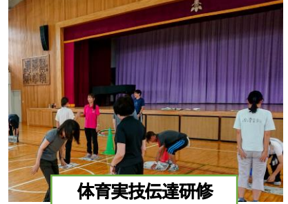
体育実技伝達研修