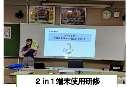
2 in 1 端末使用研修