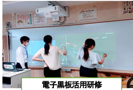
電子黒板活用研修