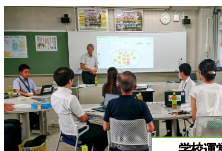
学校運営協議会研修