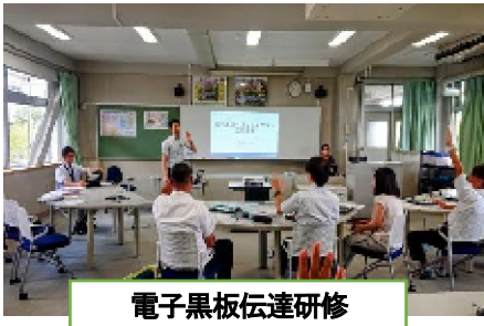
電子黒板伝達研修

夏季休業日中8/22、23日の2日間、教職員の校内研修会を実施しました。下記の写真は、各研修での課題を自分ごととして捉え、主体的に発信している「教職員の新しい学びの姿」です。このことがすべて今日からの子供たちの学習に生きてきます。共に学び合ひましょう！