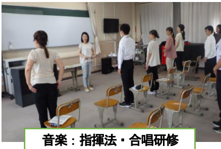
音楽：指揮法・合唱研修