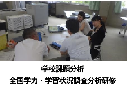
学校課題分析 全国学力・学習状況調査分析研修