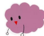
戸田中公認キャラクター しうん君 (紫雲・緑起の良い紫色の雲)

A) 体育祭や合唱祭などの学校行事の運営が円滑に進まず先生や生徒の負担が増えます。その結果、生徒の活動時間・活動場所が縮小されてしまい教育環境の悪化が懸念されます。