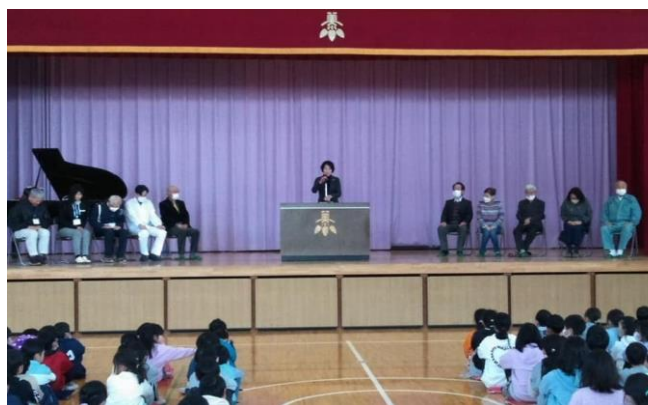
「ありがとう集会」の様子