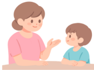
家族でおしゃべり