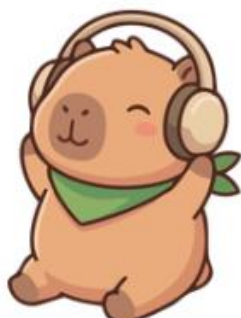
ゆっくりお風呂に入る