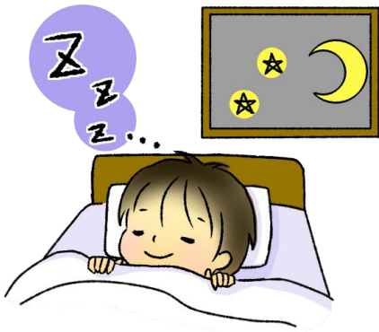
たっぷり睡眠をとる